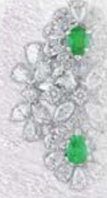
JEWELDXB EMERALD RING