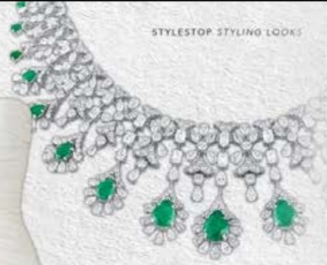
JEWELDXB EMERALD DIAMOND STATEMENT NECKLACE