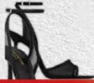
SAINT LAURENT MISSY 110 SANDALS IN MESH