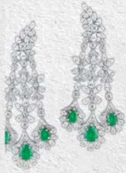
JEWELDXB EMERALD DIAMOND EARRINGS WHITE GOLD