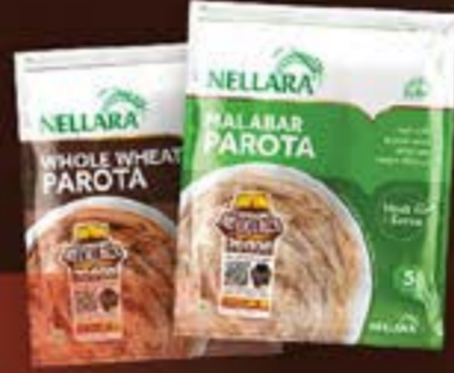
Malabar Parota • Whole Wheat Parota

From 5 th January to 5 th February across UAE